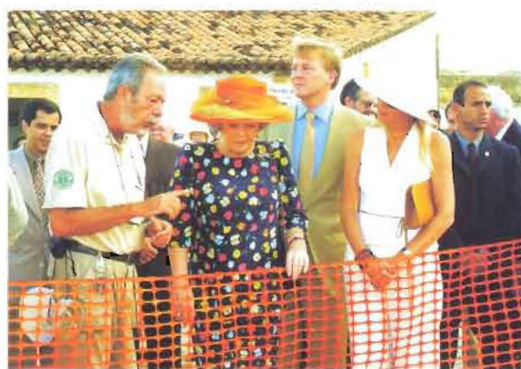
Acima, visita da CRO/7 ao canteiro de escavações.