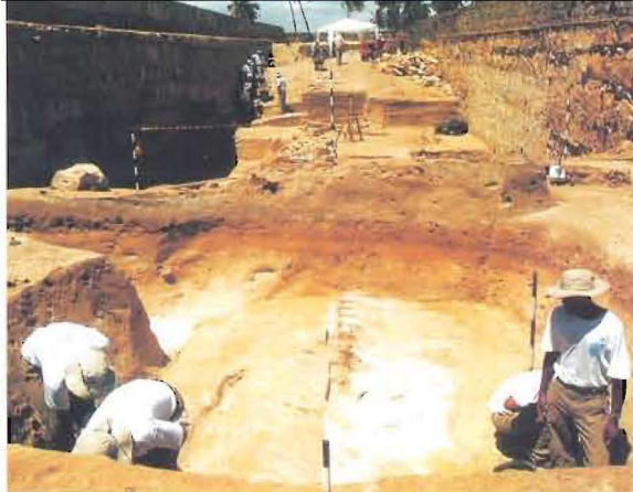
Restos da muralha do forte holandês, construída em terra.

A equipe do Laboratório de Arqueologia da Universidade Federal de Pernambuco, que se dedica há 45 anos ao estudo da arqueologia militar, sente-se gratificada por ter realizado esta pesquisa que teve resultados tão esclarecedores, tanto para os pesquisadores brasileiros quanto para os holandeses que participaram das escavações. Sente-se ainda mais gratificada pelo trabalho de educação patrimonial realizado durante as pesquisas, recebendo milhares de visitantes de diferentes classes sociais, nacionalidades e graus de instrução. Todos participaram de uma visita